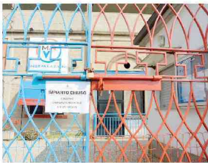
Restano ancora chiusi i cancelli dello stadio di Galliate

L'Ufficio tecnico comunale ha già effettuato un sopralluogo e confermato lo stato di fatto. Un quadro niente affatto positivo, che però non scoraggia l'assessore: «E' chiaro che non era possibile assegnarlo in queste condizioni, ma faremo il possibile perché lo stadio torni operativo entro l'autunno. Vogliamo procedere con una nuova gara visto che i problemi verranno risolti nel giro di qualche settimana. L'interesse di un paio di società c'è ed è concreto».