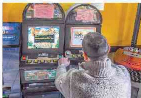
Respinto il ricorso sulle restrizioni del 2016

L'efficacia dell'ordinanza a novembre era stata sospesa dal Consiglio di Stato. Dopo