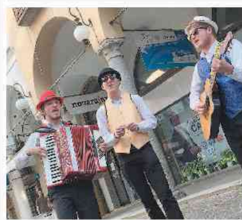
«Barlafus» Il gruppo che propone musica e cabaret sarà ospite della festa domani dalle 21

Festa patronale della Madonna del Carmelo da stasera a Borgolavezzaro: alle 20,45 la processione delle Confraternite, domani dalle 18 festa in piazza con giochi per bimbi, punti ristoro, bancarelle, esibizione dell'Asd Twirling Borgolavezzaro e alle 21,30 tributo a Ligabue con i Radiofreccia. Domenica messa alle 11 e alle 21 camminata sotto le stelle. [R.L.]