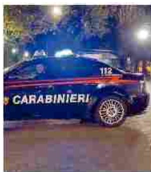
È stato preso dai carabinieri